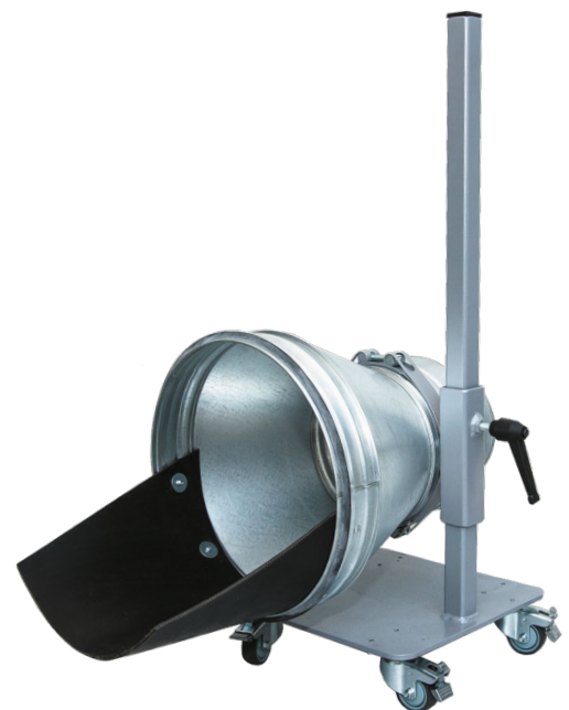
Optie: 2 e trechter