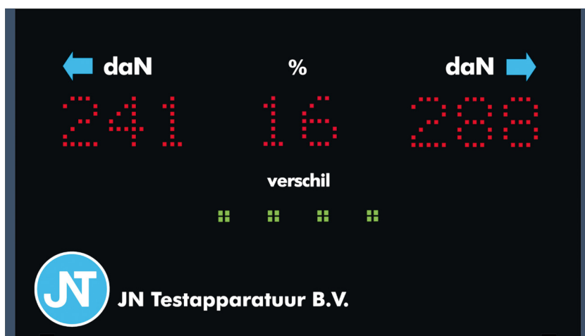
Afmetingen display: 580 x 330 x 50 mm